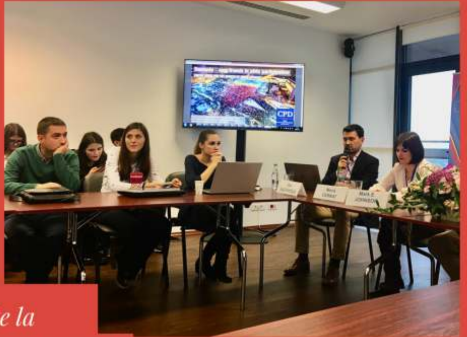
Prezentări susținute la conferințele AAPOR și WAPOR