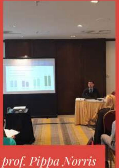
Discuție cu prof. Pippa Norris