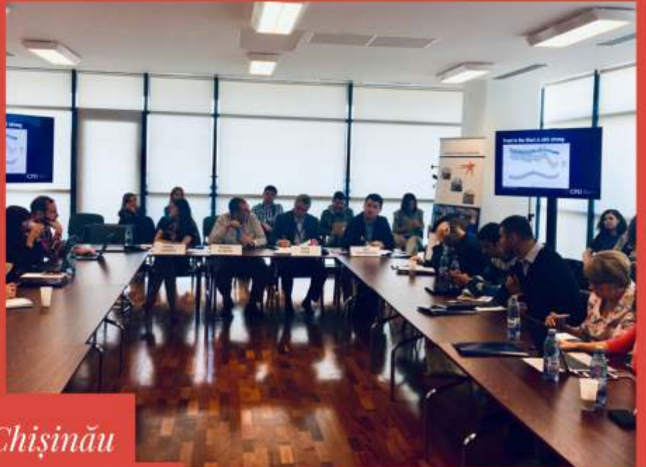
Workshop CPD la Chişinău