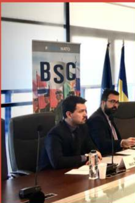
despre volumul CPD din seria NATO SPS